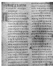
Двинская уставная грамота

Лихоимец – жадный вымогатель, взяточник».