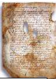
Псковская судная грамота

Уложение 1649 года. Следует заметить, что уголовное право в XVII веке развивалось в условиях резкого обострения классовых противоречий. Заметным стимулом его развития, расширения круга деяний, подлежащих уголовному преследованию, появлению новых видов преступлений, послужили события начала XVII века и восстания 30–40-х годов XVII века. Ко времени Алексея Михайловича Романова относится практически единственный народный бунт антикоррупционной направленности. Он произошёл в Москве в 1648 году и закончился победой москвичей: царём были отданы на растерзание толпе два коррумпированных «министра» – глава Земского